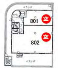
801号室 12.1坪 802号室 30.0坪