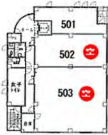
502号室 16坪 503号室 34.8坪